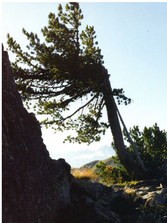
Arbre qui pourrait être perçu comme un symbole de résilience : sa cime a été coupée, et néanmoins il vit et se déploie

La résilience est un phénomène psychologique qui